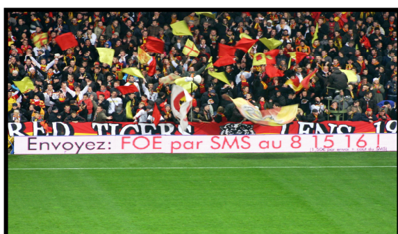
le stade Bollaert le 21.11.2010

La Fondation Cœur et Artères propose à tous de soutenir le Fonds Marc-Vivien Foé :